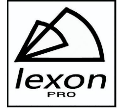
LEXON KX/V系列开关电源功放