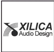
史力卡数字音频处理矩阵